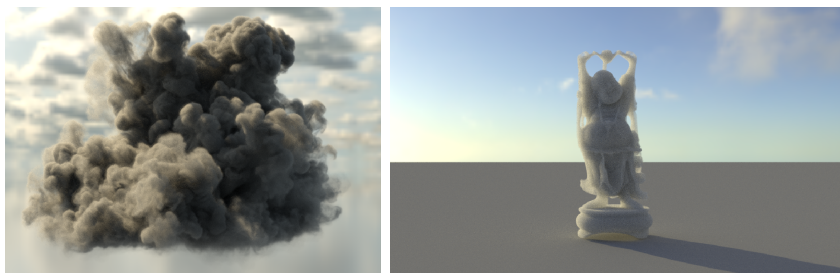
图 2: 介质渲染的效果, 异质介质 (左) 与均质介质 (右)

场景中不仅包含着表面, 同样还有参与介质。参与介质在现实生活中很常见, 如云、烟、雾等等。我们认为介质由非常非常小的微粒组成, 因此我们不能通过求交的方式判断光线与介质的碰撞情况, 而是通过基于统计的手段模拟光线在介质中的传播。