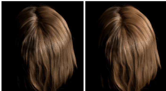
图 1: [3] 能量守恒毛发模型

参考: 毛发的主流着色模型为 [8] 提出的 BCSDf 模型。[3] 在其基础上做了改进, 提出了能量守恒的纵向散射函数。[2] 给出了重要性采样毛发的方法。[9] 给出了毛发在 pbrt 上的实现, 是一个良好的实现参考。